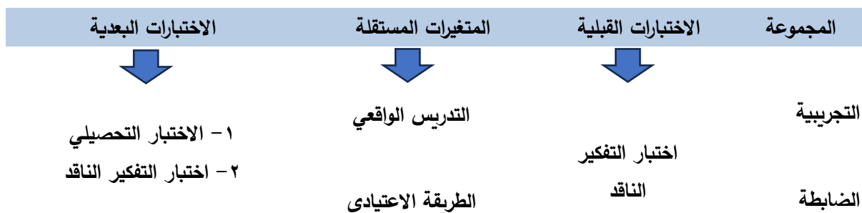
الشكل (١) يوضح التصميم التجريبي المستخدم في البحث

وقد ضبطت تأثير هذه المتغيرات وذلك لتوفير السلامة الداخلية والخارجية للتصميم التجريبي.